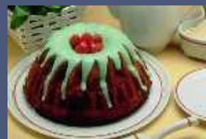
Pastry - Pasticceria