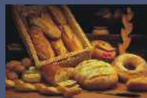
Panetteria - Bakery