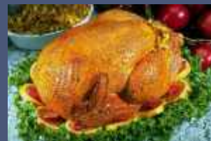
Restaurant & Catering