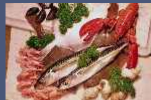
Ristorazione e Catering