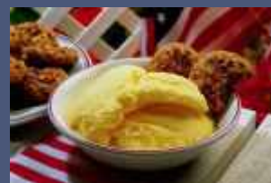
Ice cream prod. - Gelateria